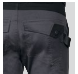
Zwei Gesäßtaschen mit Patte und Knopf

BESCHREIBUNG: 2 breite Vordertaschen, Aussen-Nageltaschen aus Nylon, ablösbar durch Reißverschluss, ergonomische Gestaltung an den Knien, Hammerschleufe, verstellbare Einfügung der Kniepolsterung aus Nylon