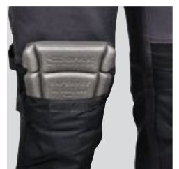
verstellbare Einfügung der Kniepolsterung aus Nylon