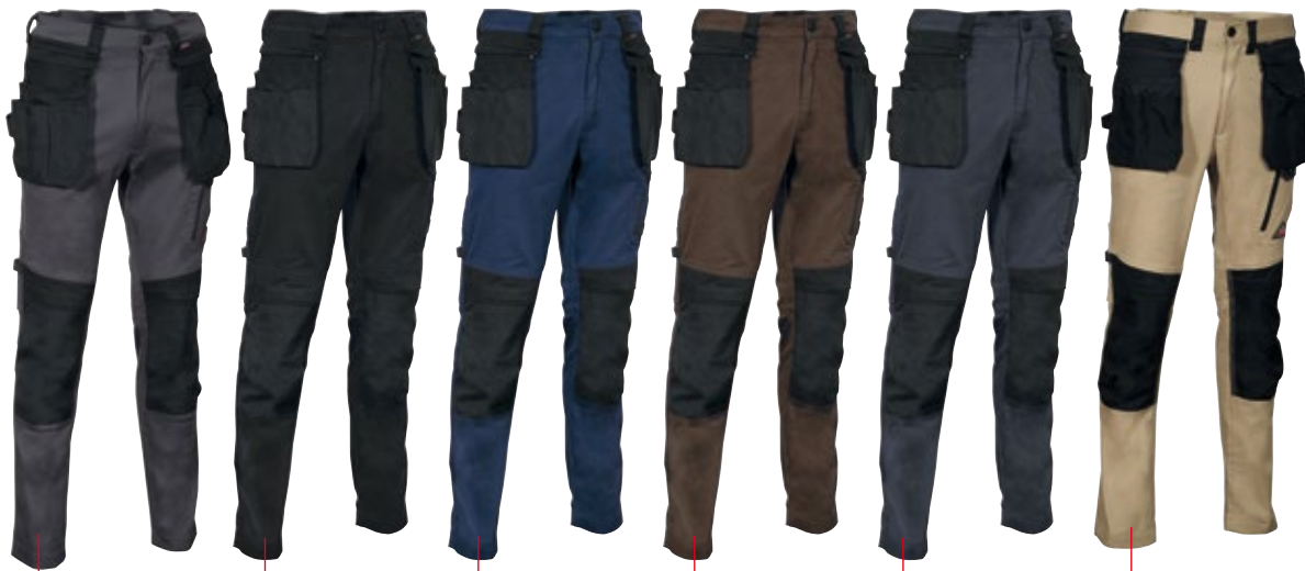
04 anthrazit/ schwarz