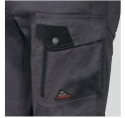
Seitentasche mit doppelter Öffnung rechts (mit Knopf und Reißverschluss)