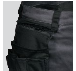
Aussen-Nageltaschen aus Nylon, ablösbar durch Reißverschluss