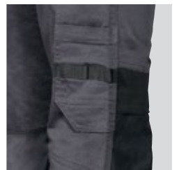
Zollstocktasche mit Gürtelschleife mit Werkzeugträger