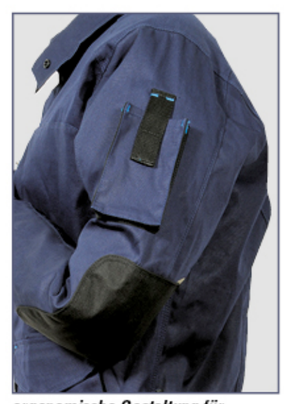
ergonomische Gestaltung für die Ärmel