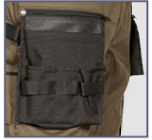
Aussen-Nageltaschen aus Nvlon

2 breite Vordertaschen, Aussen-Nageltaschen aus Nylon, ablösbar durch Reißverschluss , D-Ring, dehnbarer Stretch, doppelte Gesäßtasche mit Klettverschluss, ergonomische Gestaltung an den Knien, Hammerschlaufe, Inneres Bundband, Münzetasche, Reflex Einsätze 3M™ Scotchlite™ Reflective Material - 8725 Silver Fabric, seitliche Tasche, verstärkter Schritt, verstellbare Einfügung der Kniepolsterung aus nylon, Zollstocktasche