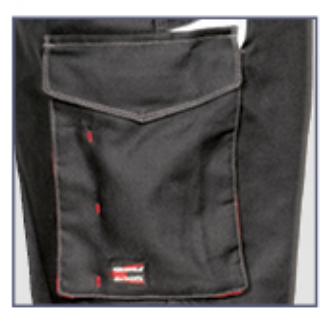
tasche für Werkzeuge

2 breite Vordertaschen, D-Ring, dehnbarer Stretch, doppelte Gesäßtasche mit Klettverschluss, Hammerschlaufe, Inneres Bundband, Münzetasche, Reflex Einsätze 3M™ Scotchlite™ Reflective Material - 8725 Silver Fabric, seitliche Tasche, verstärkter Schritt, Vortasche für Werkzeuge, Zollstocktasche