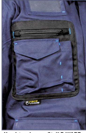
Handytasche aus Stoff E-WARD