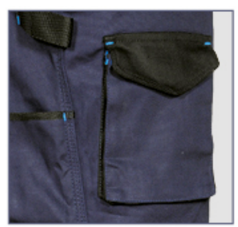
Vortasche für Werkzeuge

2 breite Vordertaschen, D-Ring, dehnbarer Stretch, doppelte Gesäßtasche mit Klettverschluss, ergonomische Gestaltung an den Knien, Hammerschlaufe, Inneres Bundband, Münzetasche, Reflex Einsätze 3M<sup>™</sup> Scotchlite<sup>™</sup> Reflective Material - 8725 Silver Fabric, seitliche Tasche, verstärkter Schritt, Vortasche für Werkzeuge, Zollstocktasche