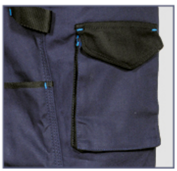
Vortasche für Werkzeuge

2 breite Vordertaschen, D-Ring, dehnbarer Stretch, doppelte Gesäßtasche mit Klettverschluss, ergonomische Gestaltung an den Knien, Hammerschlaufe, Inneres Bundband, Münzetasche, Reflex Einsätze 3M™ Scotchlite™ Reflective Material - 8725 Silver Fabric, seitliche Tasche, verstärkter Schritt, Vortasche für Werkzeuge, Zollstocktasche