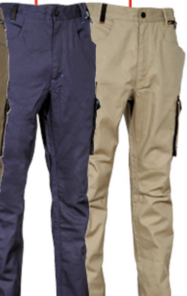
OEKO-TEX® METALLDETEKTOREN NICHT FESTSTELLBAR STANDARD 100 🍇