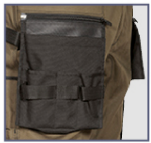
Aussen-Nageltaschen aus Nylon

2 breite Vordertaschen, Aussen-Nageltaschen aus Nylon, ablösbar durch Reißverschluss, D-Ring, dehnbarer Stretch, doppelte Gesäßtasche mit Klettverschluss, ergonomische Gestaltung an den Knien, Hammerschlaufe, Inneres Bundband, Münzetasche, Filler Einsätze 3M™ Scotchlite™ Reflective Material - 8725 Silver Fabric, seitliche Tasche, verstärkter Schritt, verstellbare Einfügung der Kniepolsterung aus nylon, Zollstocktasche