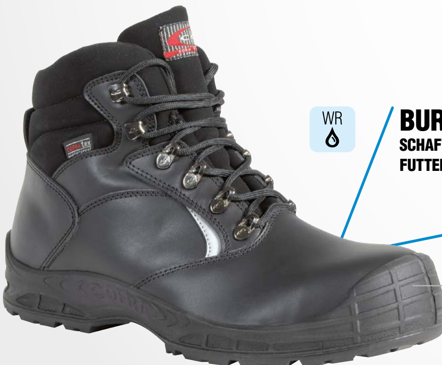
Vorderkappe aus Polyurethan